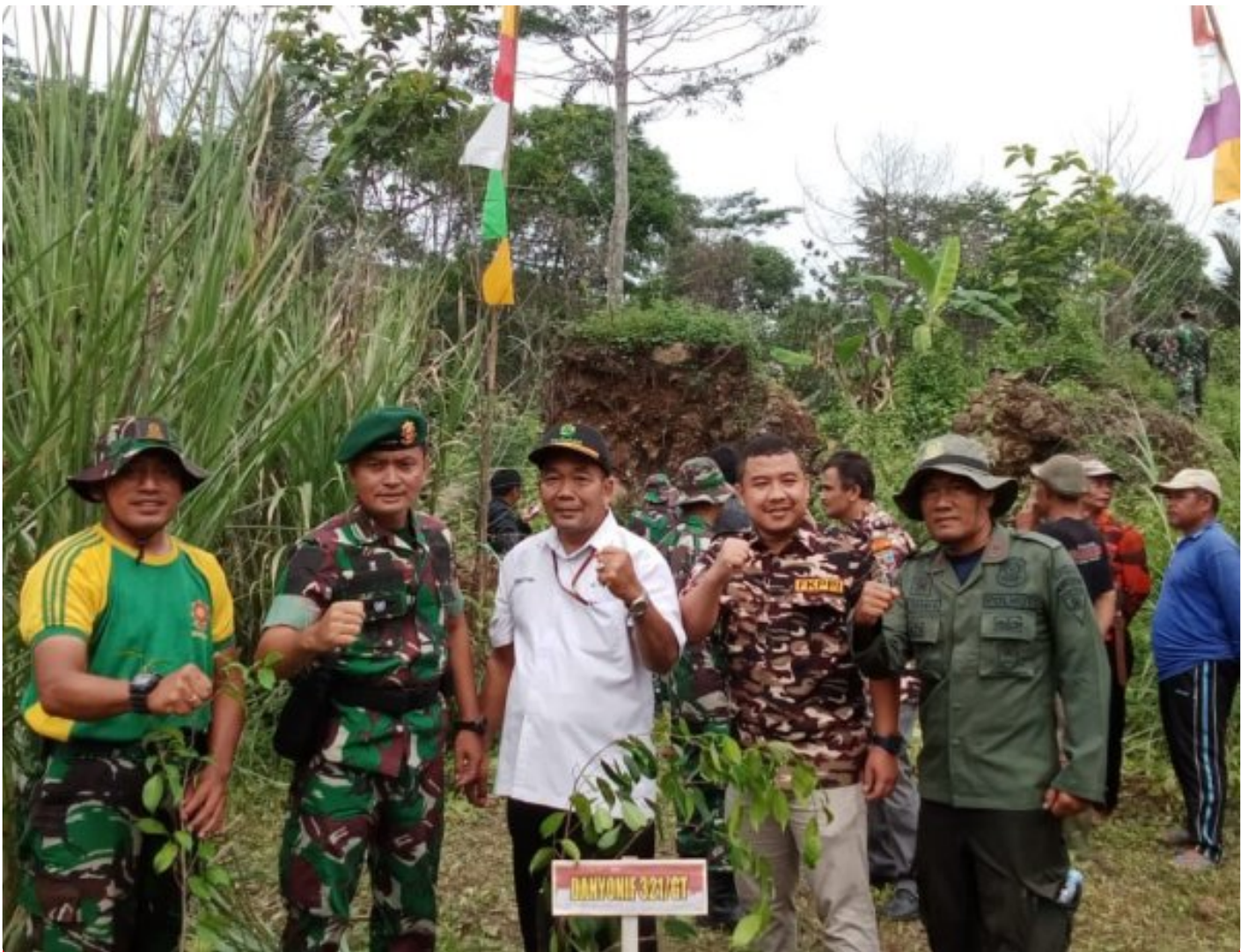
Tanam Pohon Bersama

MAJALENGKA - Kesatuan Pemangkuan Hutan (KPH) Majalengka menghadiri acara penanaman pohon bersama dengan Forum Komunikasi Pimpinan Daerah (Forkopimda) Kabupaten majalengka di Desa Pajajar, kecamatan Sindang Kabupaten Majalengka. Senin (15/01).